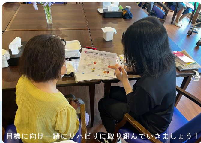
目標に向け一緒にリハビリに取り組んでいきましょう！